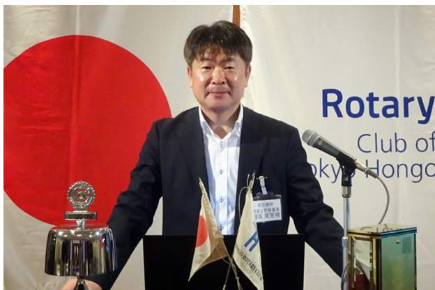
卓話をされる蛭坂様